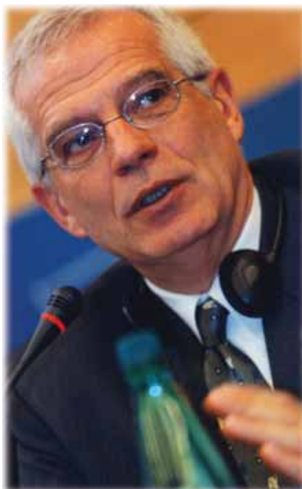
Josep Borrell Fontelles izabran je predsjednikom Europskoga parlamenta u 2004. godini