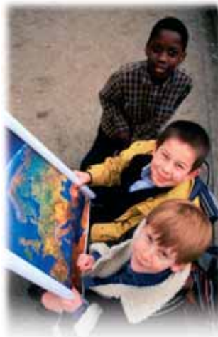
U demokratskoj Europi, budućnost Unije je u rukama ljudi – osobito mladih.

EU postoji da bi služila svojim građanima; od presudne je važnosti da je njezini građani razumiju i da su u potpunosti uključeni u njezin sustav donošenja odluka. Njoj su također potrebne učinkovite, otvorene i pouzdane institucije koje mogu zadovoljiti velike izazove 21. stoljeća.