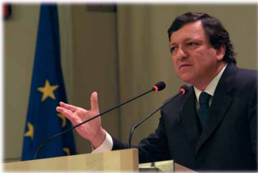
José Manuel Barroso imenovan je predsjednikom Europske komisije u 2004.