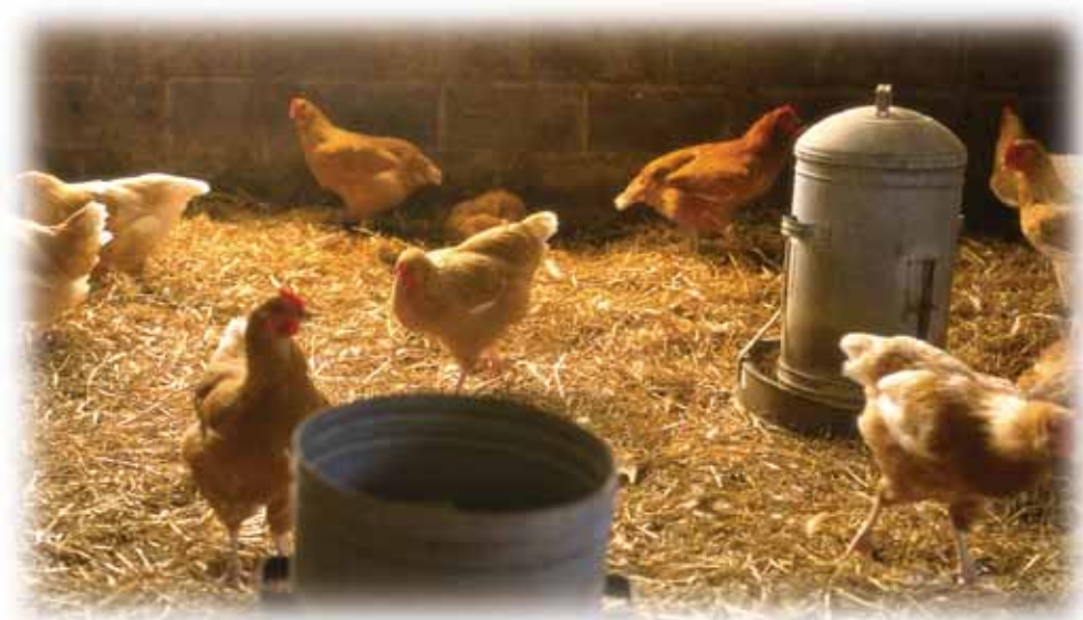
Europska agencija za sigurnost prehrambenih proizvoda pomaže osigurati sigurnost cjelovitoga procesa proizvodnje hrane – "od polja do tanjura".