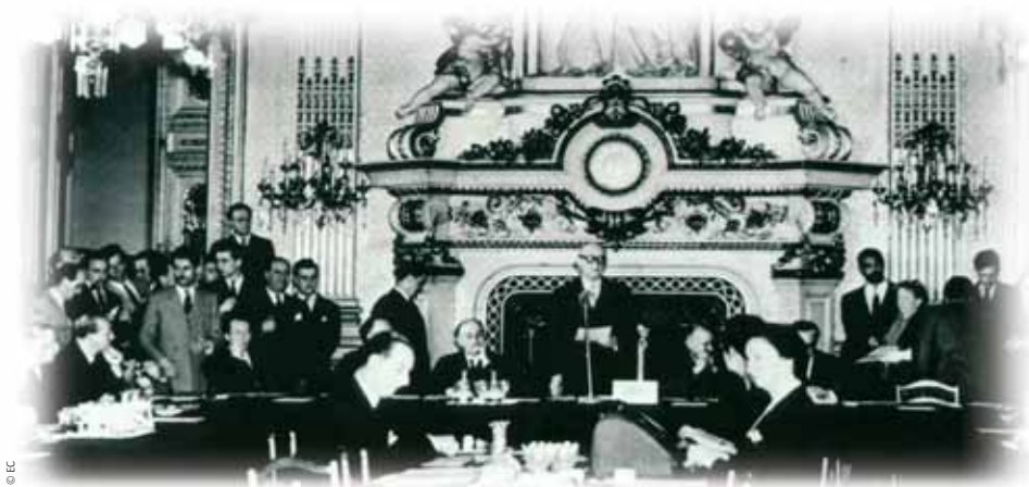
Dana 9. svibnja 1950. godine francuski ministar vanjskih poslova Robert Schuman po prvi je put izložio ideje koje su dovele do stvaranja Europske unije. Stoga se 9. svibnja slavi kao rođendan EU-a.

Osnivački ugovori temelj su za sve što EU radi. Oni su izmijenjeni i dopunjeni svaki puta kada je Uniji pristupila nova država članica. S vremena na vrijeme, osnivački su ugovori bili izmijenjeni kako bi omogućili reformu institucija Europske unije i kako bi se Uniji dale nadležnosti u novim područjima. Takve su promjene uvijek rezultat rada posebne konferencije nacionalnih vlada EU-a ("međuvladina konferencija" ili IGC), koje su se u posljednjih 20 godina održale tri puta: