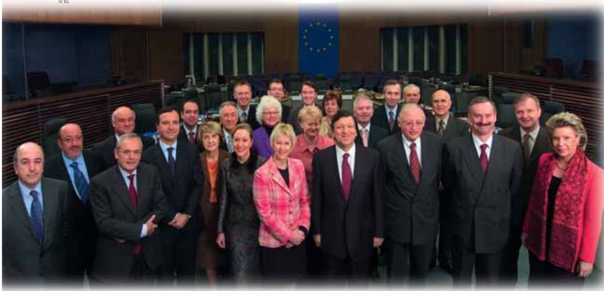
Europska komisija ima po jednoga člana iz svake države EU-a, no oni rade neovisno od nacionalnih vlada. Sastaju se svake srijede kako bi raspravili politike EU-a i predlagali novo europsko zakonodavstvo.